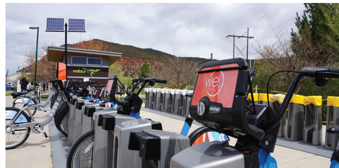
The Carbondale Park & Ride WE-cycle station nearing the end of construction in May.

17 stations and 107 bikes await you. we-cycle.org